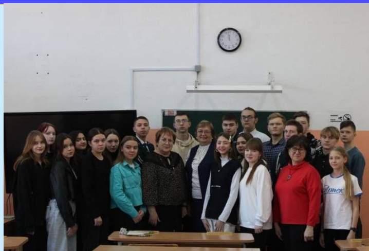
К 30-летию Конституции РФ и 75-летию Всеобщей декларации прав человека

ОМБУДСМЕН (от швед. ombudsman – поверенный агент, представитель ), уполномоченный по правам человека (ребенка), назначенный парламентом на основе закона в целях осуществления независимого контроля за исполнением конституционных обязательств государства о признании и соблюдении прав и основных свобод человека и их государственной защиты.